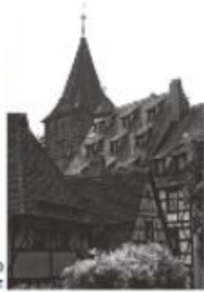
ニュルンベルクのオーバーレシュミートガッセ

レグニツ川の両岸に発展した人口50万の大都市。16世紀以降の立派な木造建築が多く、画家デューラーの家や職人広場、ヘンカー橋+ワイン蔵などが有名です。