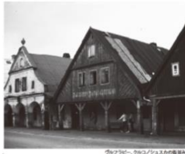
ヴルフラビー、カルクシュス川の橋頭

エルベ(ラーベ)川の上流河畔に位置する鉱工業で栄えた人口1.3万の町。妻入りの木造井楼組に切妻屋根とアーケードが連なる独特な街並みが有名です。