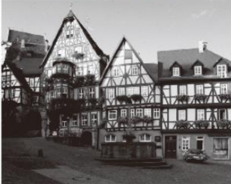
ミルテンベルクのマルクト広場

普通の観光コースでは滅多に寄らない、マイン川沿いに栄えた人口約1万の美しい町。マルクト広場をはじめ、素晴らしい木造建築が続く街並みが見もの。