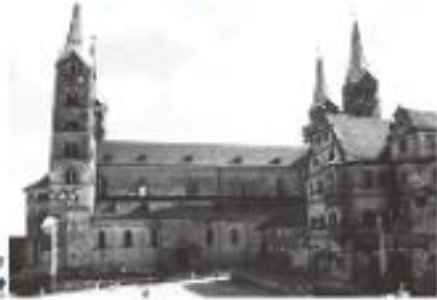
バンベルク大聖堂

マインの支流レグニツ川を挟む7つの丘に築かれた世界遺産の都市大聖堂、新宮殿、旧市庁舎や木造の家々など、素晴らしい建築群が中心部に凝縮しています。