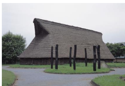
▲史跡根古谷台遺跡（宇都宮市）