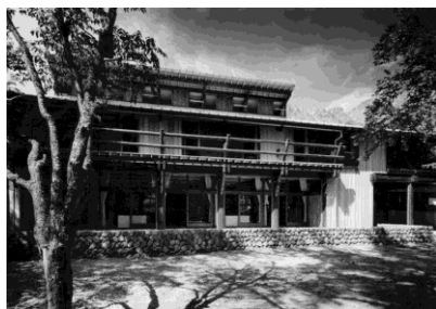
▲五千尺ロッヂ（1965年竣工） 設計：太田邦夫、生田勉、山本明夫

【主な建築設計作品】「ほっこ山荘」（蓼科、1962年）、「三笠の家」（軽井沢 1963年）、「五千尺ロッヂ」（上高地、1965年）、「松本の家」（松本、1966年）、「奎太良」（蓼科、1972年）、「史跡根古谷台遺跡（復原設計）」（宇都宮、1990年）